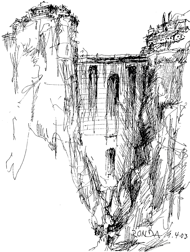
Andalusienreise 2003 – Ronda: Puente Nuevo , die tiefe Schlucht El Tajo überbrückend